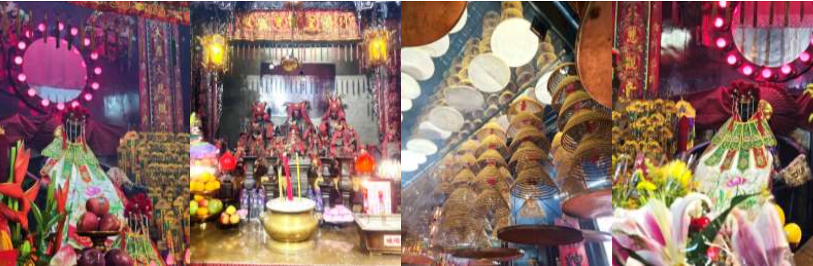
วัดหล่งโหมว (Lung Mo Temple)