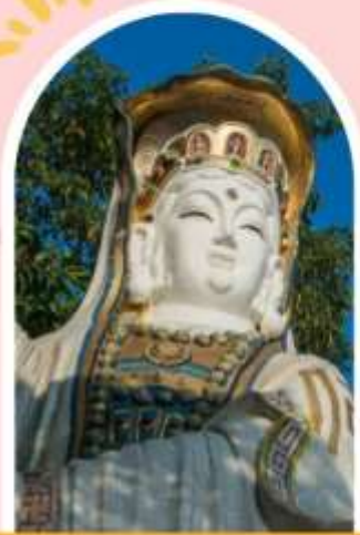
รีพลัสเบย์