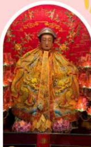
วัดหลังโหมว

ความสำเร็จ ความมั่งคั่ง เงินทองไหลมาเทมา