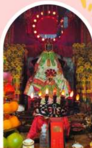
วัดเจ้าแม่กวนอิมอ่องฮำ

ความสำเร็จ ความมั่งคั่ง เงินทองไหลมาเทมา