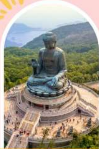
นั่งกระเชานองปิง