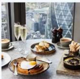
DUCK AND WAFFLE