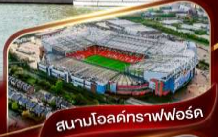
สนามโอลด์แทรฟฟอร์ด