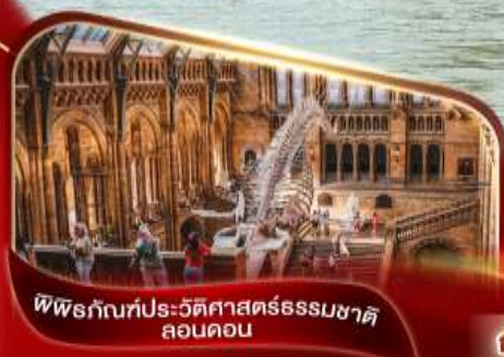
พิพิธภัณฑ์ประวัติศาสตร์ธรรมชาติ ลอนดอน