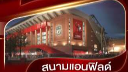
สนามแอนฟิลด์