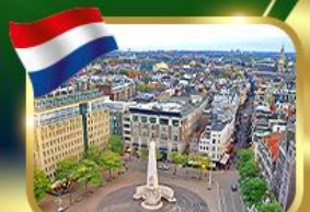
จัตุรัสดีนสแควร์ อัมสเตอร์ดัม