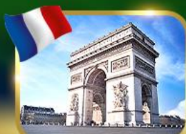
ประตูชัยฝรั่งเศส ปารีส