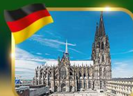
มหาวิหารแห่งเมืองโคโลญ