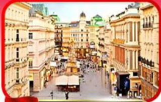
ย่านคาร์กเนออสตรีก