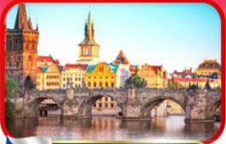
เขื่อนอินสพานชาร์ลส์