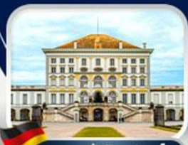
พระราชวังนิมเฟนบวร์ก