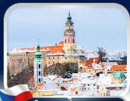
เมืองเช็ก คุลมอฟ