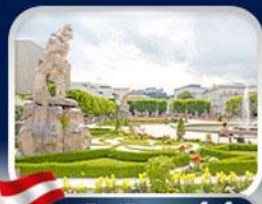
สวนมิรานา ซาลซ์บูร์ก