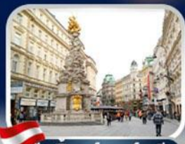
ซ็อมป์การ์ทเนอร์สตรีท