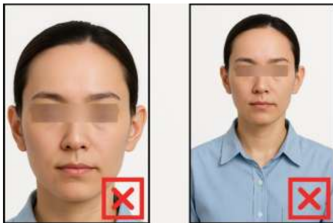
รูปที่ไม่ได้ขนาด ตามที่สถานทูตกำหนด