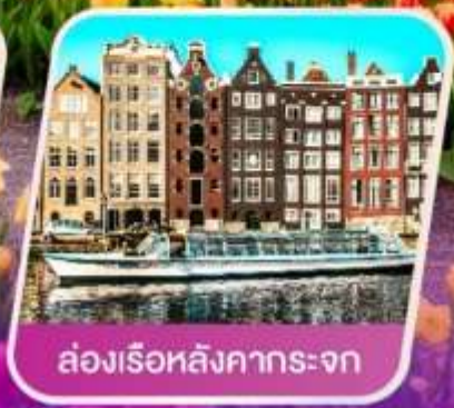
ล่องเรือหลังคากระຈก