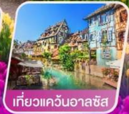
เที่ยวแคว้นอาลซัส