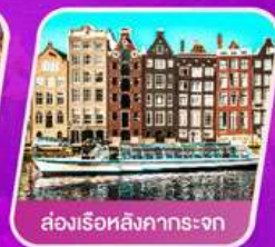
ส่องเรือสิงคารถะจก