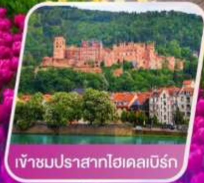
เข้าชมปราสาทไฮเคลมเบิร์ก