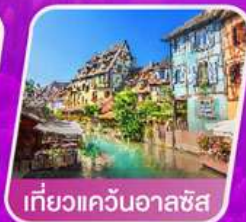
เที่ยวแคว้นอาลซัส