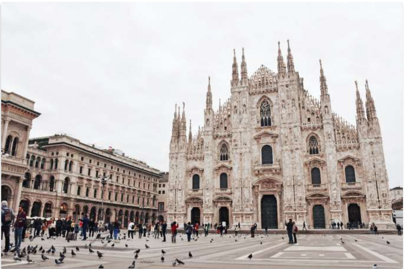
DUOMO DI MILANO

เมืองมิลาน (Milan) มิลานเป็นเมืองสำคัญทางตอนเหนือของประเทศอิตาลี ตั้งอยู่บนที่ราบลอมบาร์ดี โดยชื่อ "มิลาน" มีรากศัพท์มาจากภาษาของชาวเซลต์ คือ "Mid-Lan" ซึ่งมีความหมายว่า “กลางที่ราบ” เมืองมิลานมี ชื่อเสียงระดับโลกในด้านแฟชั่น ศิลปะ และวัฒนธรรม และยังเป็นหนึ่งในเมืองหลักทางเศรษฐกิจของอิตาลีอีก ด้วย นำท่านถ่ายภาพเป็นที่ระลึกบริเวณด้านหน้าของ “มหาวิหารมิลาน” (Duomo di Milano) หนึ่งในมหา วิหารสไตล์กอธิคที่ใหญ่ที่สุดในโลก (ค่าทัวร์ไม่รวมค่าเข้าชมในของมหาวิหารแห่งเมืองมิลาน) นอกจากนั้นให้