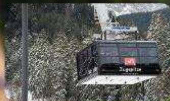
นั่งกระเช้าซูกสปีตซ์