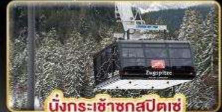
นั่งกระเช้าชุกสปีตซ์