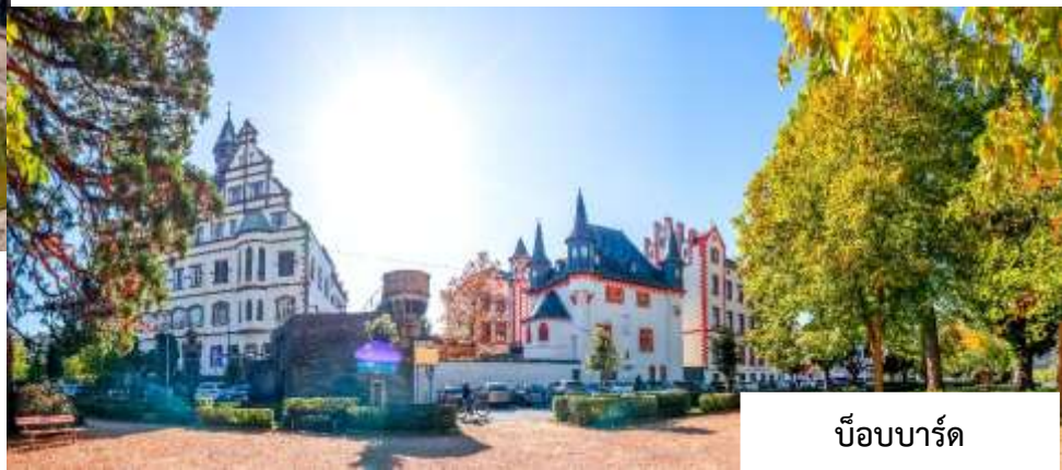
บ็อบบาร์ด (Boppard)

จากนั้นทุกท่านสามารถเดินชมได้ตามอัครยาคัย ชมบรรยากาศของเขตเมืองเก่าโคโลญจ์ ที่เต็มไปด้วยเสน่ห์ของอาคารเก่าแก่และถนนสายประวัติศาสตร์ พร้อมเลือกซื้อสินค้าพื้นเมือง ของที่ระลึกขึ้นชื่อ อาทิ น้ำหอมโคโลญจ์ 4711 อันเป็นต้นกำเนิดของน้ำหอมประเภท "โคโลญจ์" รวมถึงสินค้าแบรนด์เนมชื่อดังนานาชนิดที่เรียงรายอยู่ตลอดแนวถนนคนเดิน (Walking Street) รอบบริเวณมหาวิหาร นำท่านเดินทางสู่ เมืองบ็อบบาร์ด (Boppard) เมืองเล็กๆ อันเจียบสงบที่ตั้งอยู่ริมฝั่งแม่น้ำไรน์ตอนกลางของประเทศเยอรมนี เมืองแห่งนี้เปี่ยมด้วยเสน่ห์ของสถาปัตยกรรมเก่าแก่และยังเป็นบ้านเรือนสีสันสดใสที่ได้รับการอนุรักษ์ไว้อย่างดี ประกอบกับทัศนียภาพอันงดงามของแม่น้ำไรน์และธรรมชาติโดยรอบ