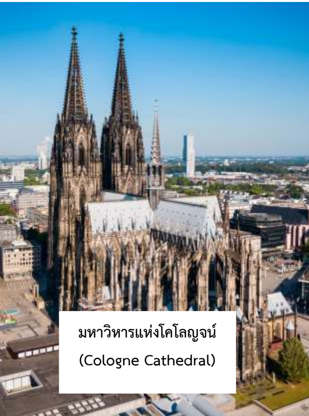
มหาวิหารแห่งโคโลญจ์ (Cologne Cathedral)

จากนั้นทุกท่านสามารถเดินชมได้ตามอัครยาคัย ชมบรรยากาศของเขตเมืองเก่าโคโลญจ์ ที่เต็มไปด้วยเสน่ห์ของอาคารเก่าแก่และถนนสายประวัติศาสตร์ พร้อมเลือกซื้อสินค้าพื้นเมือง ของที่ระลึกขึ้นชื่อ อาทิ น้ำหอมโคโลญจ์ 4711 อันเป็นต้นกำเนิดของน้ำหอมประเภท "โคโลญจ์" รวมถึงสินค้าแบรนด์เนมชื่อดังนานาชนิดที่เรียงรายอยู่ตลอดแนวถนนคนเดิน (Walking Street) รอบบริเวณมหาวิหาร นำท่านเดินทางสู่ เมืองบ็อบบาร์ด (Boppard) เมืองเล็กๆ อันเจียบสงบที่ตั้งอยู่ริมฝั่งแม่น้ำไรน์ตอนกลางของประเทศเยอรมนี เมืองแห่งนี้เปี่ยมด้วยเสน่ห์ของสถาปัตยกรรมเก่าแก่และยังเป็นบ้านเรือนสีสันสดใสที่ได้รับการอนุรักษ์ไว้อย่างดี ประกอบกับทัศนียภาพอันงดงามของแม่น้ำไรน์และธรรมชาติโดยรอบ