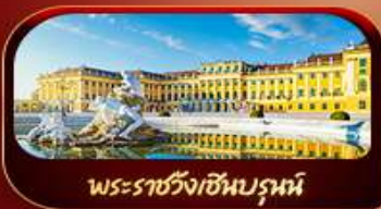
พระราชวังเซินบรูน์

ฟรีแอด 29 พ.ค.-05 มิ.ย.69 / 02-19 มิ.ย.69 / 21-28 ก.ค. 69 05-12 ส.ค. 69 / 16-23 ก.ย.69