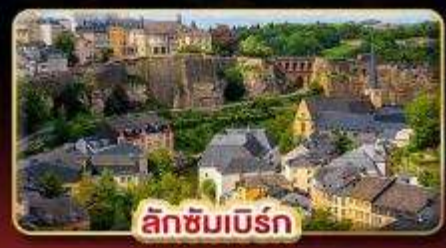
ลักซิมเบิร์ก

ที่สุดของธรรมชาติ แห่ง “ยุโรป” สวนดอกไม้ KEUKENHOF 1ปีมีครั้งเดียว