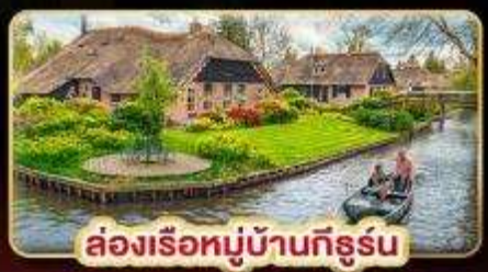
ล่องเรือหมู่บ้านกังหัน