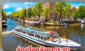
สองเรือหลังคากระจก