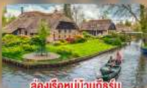
สองเรือหมู่บ้านทึร์น