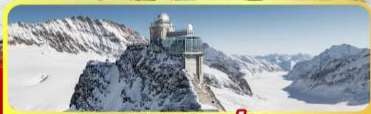
ยอดเทวจุ่งเฟรา