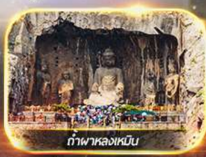
ถ้ำพาลงเหมิน