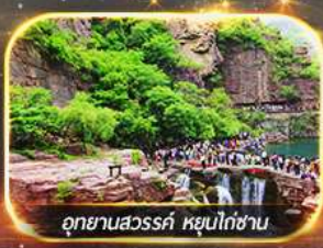
อุทยานสวรรค์ หยุนโก่ซาน