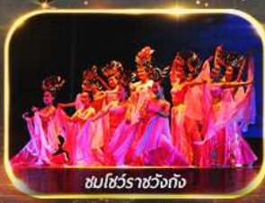
ชมโชว์ราชวงศ์ถัง

นั่งรถไฟความเร็วสูง ย้อนประวัติศาสตร์อันยิ่งใหญ่ "กองทัพทหารจิ้นซี" สัมผัสความงามอุทยานสวรรค์ พิเศษ!! ชมโชว์ราชวงศ์ถัง เก็บครบทุกไฮไลท์ ซ้อมบ๊องจิว ห้าง WU YUE