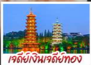
เจดีย์เงินเจดีย์ทอง