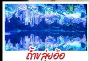
ถ้ำฟลุ่ย์อ้อ