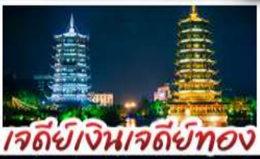
เจตีย์เงินเจตีย์ทอง

หมู่บ้านแม้วซีเจียง - จิวจายโกวน้อย - เสียวชีโฮว เมืองโบราณเขยฮือ+ล่องเรือ - เจตีย์เงินเจตีย์ทองวิวคำ เขางวงช้าง - สะพานแดงหรูอี้ - รถไฟความเร็วสูง ไม่ลงร้านช้อปปิ้ง - เมบูพิเศษ บูฟเฟ่ต์ชาบูซีฟู้ด ปลาอบเนียร์ เผือกคริสตัล สุกี้เท็ด