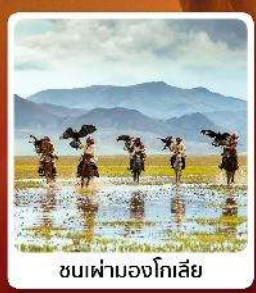
ชนเผ่ามองโกเลีย