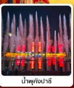
น้ำพุคังปาซี

● ไอลัก เป็นทราseyเสียงชาวมองโกลแห่งที่ระดับ 5A ของจีน ภูเขาไฟอูลันฮาตา น้ำพุคังปาซี น้ำพุที่สูงที่สุดในเอเชีย