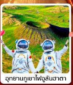
อุทยานภูเขาไฟอูลันฮาตา