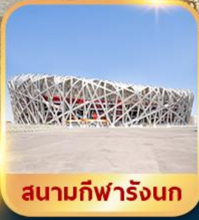
สนามกีฬาปักกิ่ง