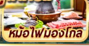
หม้อไฟมองโกล