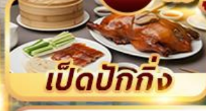
เป็ดปักกิ่ง