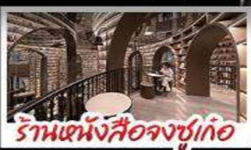
ร้านหนังสือจุกเท่

อุทยานภูทาสัตว์ครึ่ง อุทยานป่านิงทิว หนีแพนด้านอนเซฟ ร้านหนังสือจุกเท่ วัดต้าฉือ ถนนโบราณความจำ ซิปป์ง่าบคิง ถนนไท่กู่หฺสึ + ถนนซุนซีตู้ เมนูพิเศษ สุกี้หม่าล่าเสฉวน