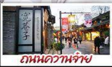
ถนนความจำ