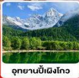
อูทยานปี้ฝิงโถว