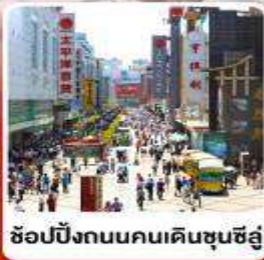
ช้อปปิงถนนคนเดินชุนซีลู่