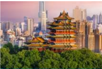
นครนานกิง