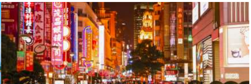
ถนนคนเดินหนานจิงจู่

จากนั้นนำท่านเดินทางสู่ ย่านช้อปปิ้งที่ใหญ่และคึกคักที่สุดของมหานครเซี่ยงไฮ้ ถนนคนเดินหนานจิงจู่ 南京路步行街 ให้ท่านเพลิดเพลินกับการเดินเที่ยว ชม และ ช้อปปิ้ง ชิมอาหารหรือของท่านเล่นอย่างจุใจ ในย่านถนนคนเดินนี้ นอกจากร้านค้าสินค้าแบรนด์เนมจากต่างประเทศแล้ว สินค้าแฟชั่น และสินค้าแบรนด์