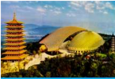
อุทยานหนิวโล่วซาน