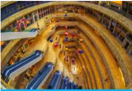
จัตุรัสเต๋อจี