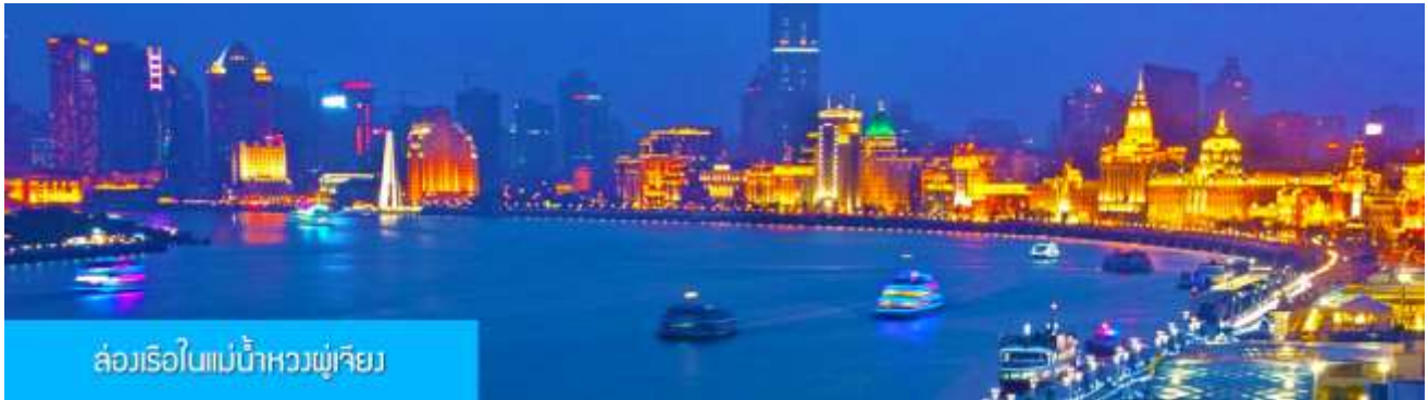
ล่องเรือในแม่น้ำหวงผู่เจียง