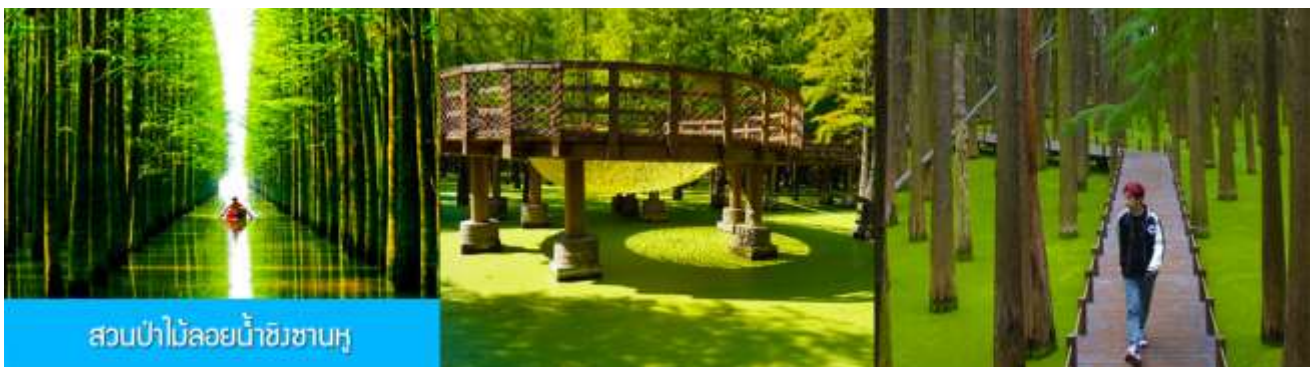
สวนป่าไม้ลอยน้ำชิงชานหู

พักที่ โรงแรม Holiday Inn Express Hotel 4* หรือเทียบเท่าในนครเซี่ยงไฮ้