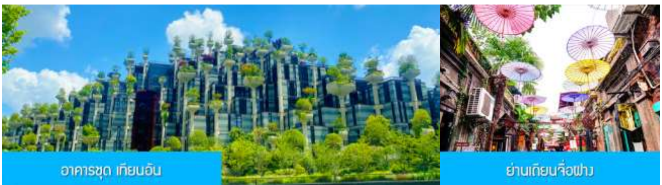
อาคารชุด เทียนอัน