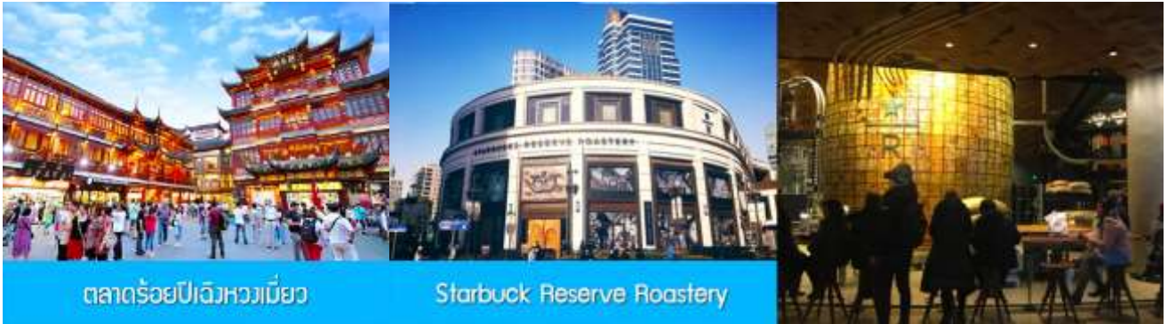
ตลาดร้อยปีเฉิงเหมียว

พักที่ โรงแรม Holiday Inn Express Hotel 4* หรือเทียบเท่าในนครเชียงใหม่