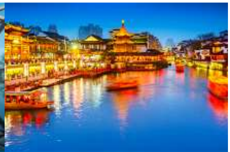
ย่านฟูจื่อเมี่ยว