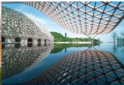
อุทยานก่อกว่กั๋วเหวินโถ้วซาน