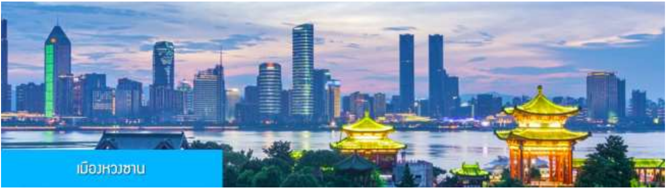
เมืองหวงซาน