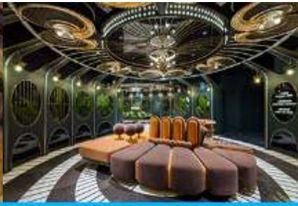
ห้องน้ำไอเทค