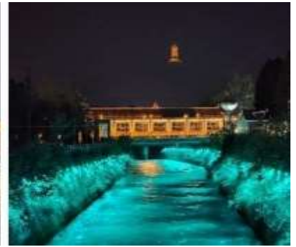
เขื่อนตูเจียงเยี่ยน

ที่พัก LIWAN HOLIDAY HOTEL DUJIANGYAN หรือเทียบเท่า 4 ดาวจีน