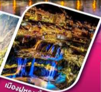
เมืองฝูหรงจิ้น