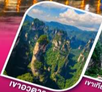
เจาอวตาร