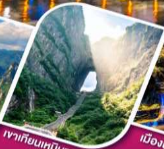
เจาเทียนเหมินซาน