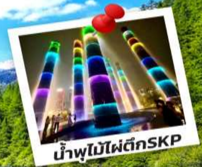
น้ำพุไม้ไฟตึกSKP

อุทยานปี้เผิงโกว อุทยานจิวจ้ายโกว วัน 5 คืน