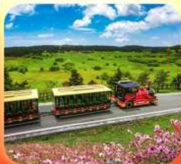
"อุทยานเขานางฟ้า"

บินตรงลงชิง • อุ่หลง หลุมฟ้าสะพานสวรรค์ • ระเบิดงิ้ว • อุทยานเขานางฟ้า หงหยาดัง • นิ่งรถไฟทะลุติ๊ก • ล่องเรือชมฉางชิ่งยามค่ำคืน • ศาลาประชาคม (ด้านนอก) มรดกโลกผาหินแกะสลักต้าจู้ • เมืองโบราณสี่ปาที้ • วัดหลิวฮั่น • ตึกตะเกียบ