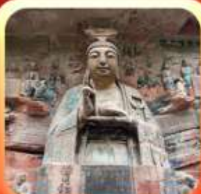
"ผาหินแกะสลักต้าจู้"