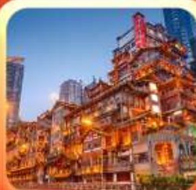
"ล่องเรือชมวิวหงหยาดัง"