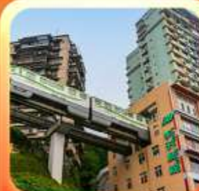
"นึ่งรถไฟทะลุติ๊ก"