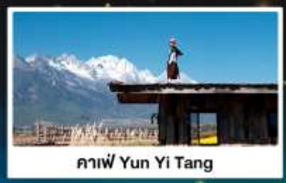
กาแฟ Yun Yi Tang