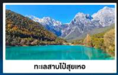
ทะเลสาบไปสูยเหอ