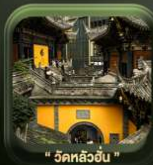
" วัดหลิวอัน "