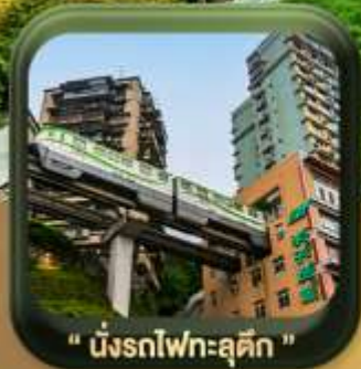
" นิ่งรถไฟทะเล " (Ning Railway Sea)

บินตรงลงฉงชิ่ง • อุ่หลง หลุมฟ้าสะพานสวรรค์ • ระเบียบแก้ว • อุทยานเขานางฟ้า หงหยาดัง • นิ่งรถไฟทะเล • ศาลาประชาคม (ด้านนอก) • หลงหมินฮ่าว มรดกโลกผาหินแกะสลักต้าจู้ • วัดหลิวอัน • ตึกตะเกียบ • ถนนคนเดินเจียฟางเป่ย์