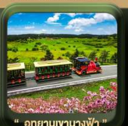
" อุทยานเขานางฟ้า "

T2G-CKG26CZ Special of Chongqing...ฉงชิ่ง ต้าจู้ อุ่หลง อุทยานหลุมฟ้า เขานางฟ้า 5D 3N (CZ)