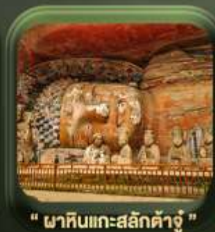
" ผาหินแกะสลักต้าจู้ "