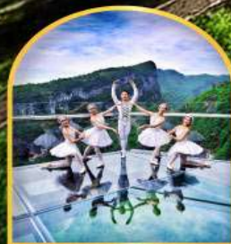
ระเบียบแกว้อหลง