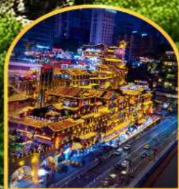
ตลาดหงหยาดัง