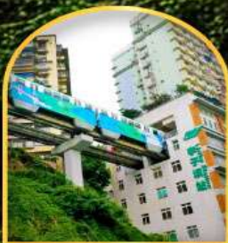
สถานีนรกไฟ-ลุดัก