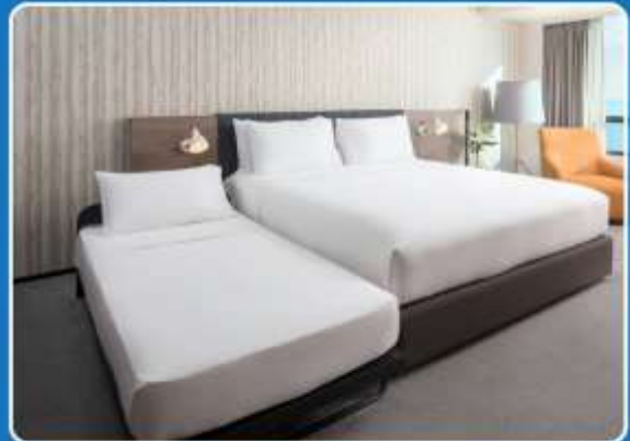
👤👤+👤 TRIPLE (TRP)

**รูปภาพห้องพักเป็นเพียงภาพสื่อถึงประเภทของเตียงเท่านั้น ไม่ใช่ภาพห้องพักจริงสำหรับการเข้าพัก**