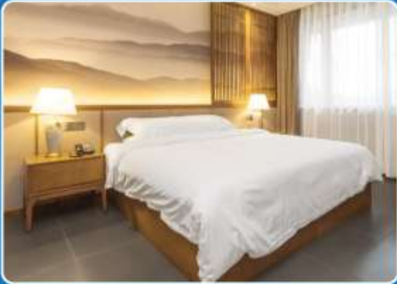
👤 SINGLE (SGL)