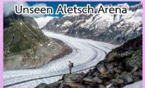
Unseen Aletsch Arena