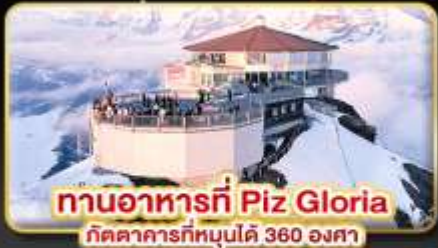
ทานอาหารที่ Piz Gloria ภัตตาคารที่หมุนได้ 360 องศา