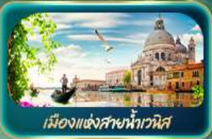
เมืองแห่งสายน้ำเวนิส

จุดบรรจบความอลังการของธรรมชาติ Dolomites และ ทะเลสาบมิซูรีน่า ชมน้ำสิเกอร์ควอยซ์ ทะเลสาบเบรียส สุดโรแมนติกเมืองแห่งสายน้ำไวน์ส ห้ามพลาด มหาวิหารดูโอโมแห่งมิลาน โรมัน ฮาร์น่า บ้านของจูเลียต เที่ยวลูเซิร์น ชมสิงโตหินแกะสลัก เดินเล่นสะพานไม้อาเปลา อินส์บรุค ย้อนอดีตกับเฮาเซนด์แอนน์ หลังคาทองคำ ช้อปปิ้ง Outlet