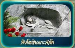
สิงโตหินแกะสลัก