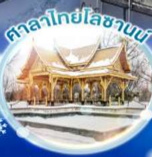
ศาลาไทยโลซานน์