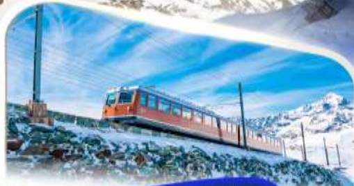
ขึ้นรถไฟฟันเฟืองก่อนนอร์แอนด์