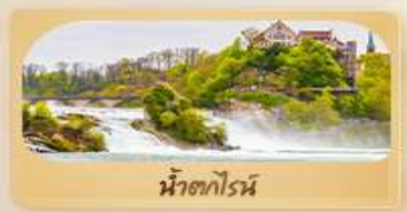
น้ำตกโรน

เที่ยวสวิตเซอร์แลนด์ สวรรค์แห่งนักผจญภัย พิชิตยอดเขา Grindelwald First และ Jungfrau ไม่พลาดเมืองดังลูเซิร์น ซูริค อินเทอร์ลาเคน ชุก กรุงเบิร์น เพลินตากับความงดงาม สะพานไม้ชาเปล สิงโตแกะสลัก นาฬิกา ไซท์ กล็อกเคิล ไลน์สโตนเฮาส์ ชมความน่ารักบ่อหมีสีน้ำตาล พลังน้ำที่ยิ่งใหญ่ ที่สุดในยุโรป! น้ำตกโรน ซุปป์ิงถนนบานโฮฟชตราเซอร์