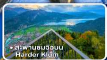
• สะพานชมวิวมุม Harder Klum