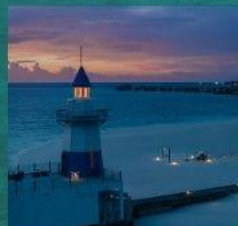
Light House Restaurant