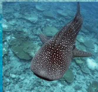
Whale Shark Snorkeling